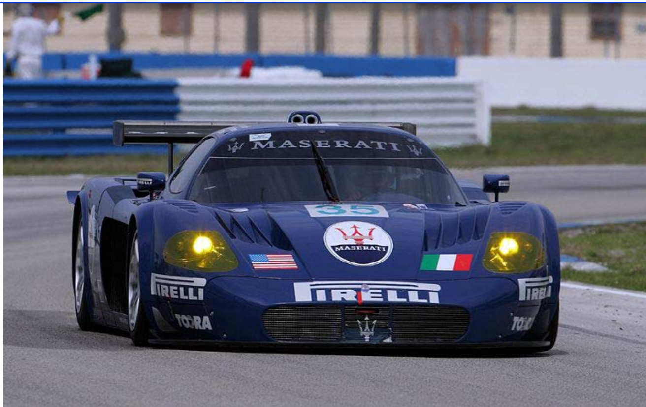
FIA GT e ALMS: CACCIA AL TITOLO

CLUB GRETA EMME.IT REGISTRO GRETA EMME.IT