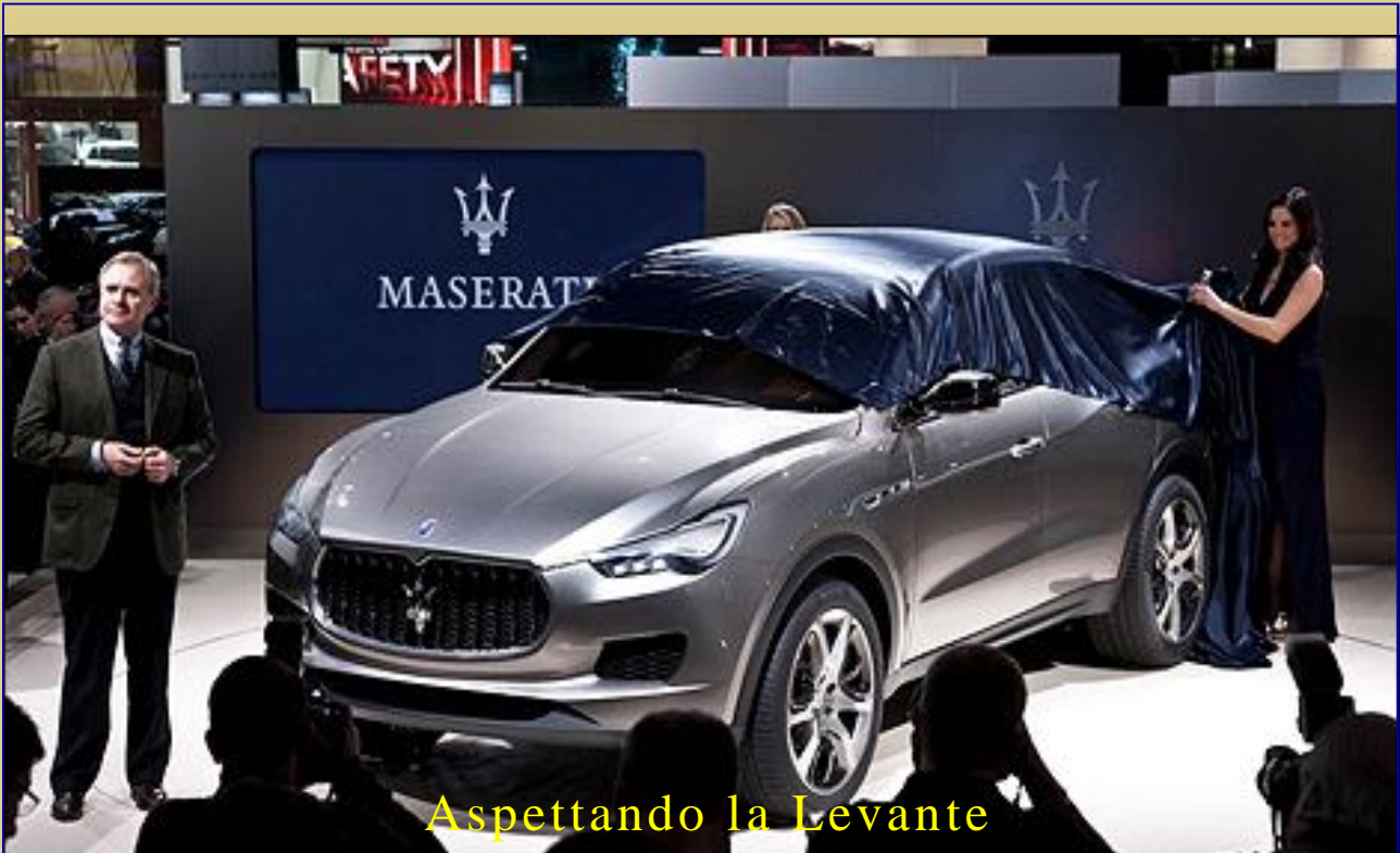
Aspettando la Levante