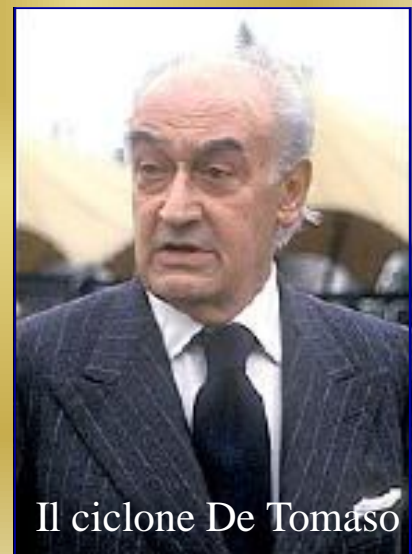
Il ciclone De Tomaso